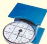
ばね式指示はかり