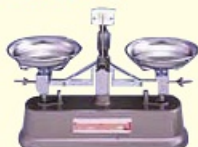
等比皿手動はかり