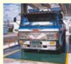
トラックスケール (車載貨物ごとはかる大型のはかり)

定期検査が行われている「はかり」の例です。 分銅・増しおもりも検査対象となります。