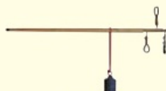
棒はかり (綿・寝具店)