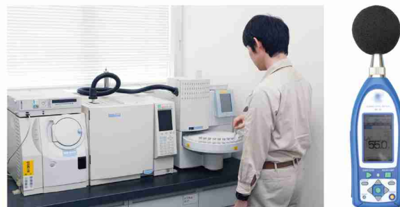
写真左: ガスクロマトグラフ-質量分析装置 / 写真右: 騒音計

が可能ないわゆる機器分析法が主流となっており、環境計量士の役割もこれらを駆使するためのスキルも必要となっています。